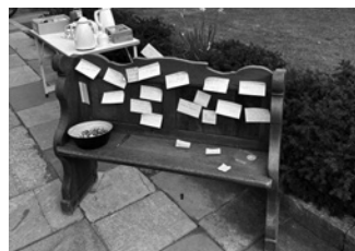
Pfarrhaus St. Martinus