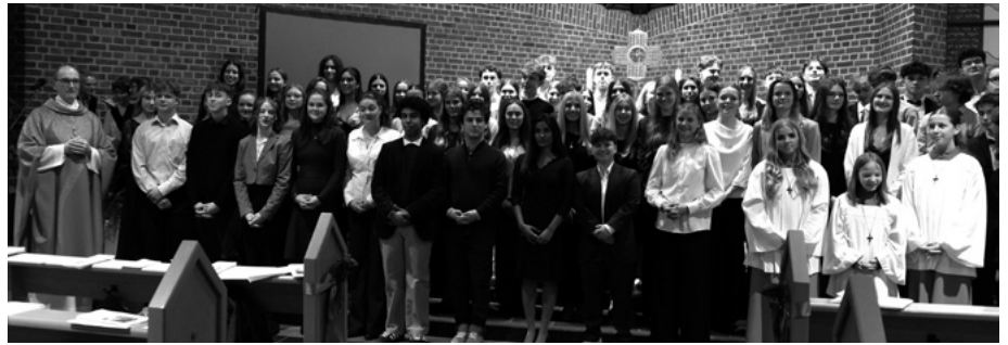
Gottesdienst am 19.11.2025