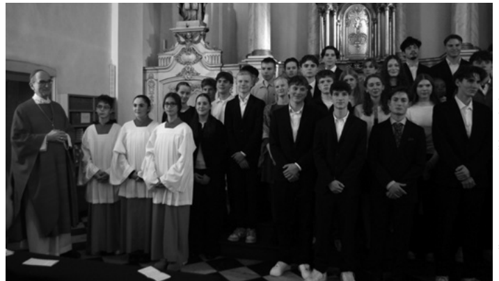
Gottesdienst am 03.12.2025